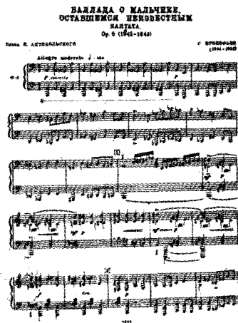
С. Прокофьев. Баллада о мальчике, оставшемся неизвестным. Обложка. Первый лист.

И в первой же боевой схватке его сразила вражеская пуля.